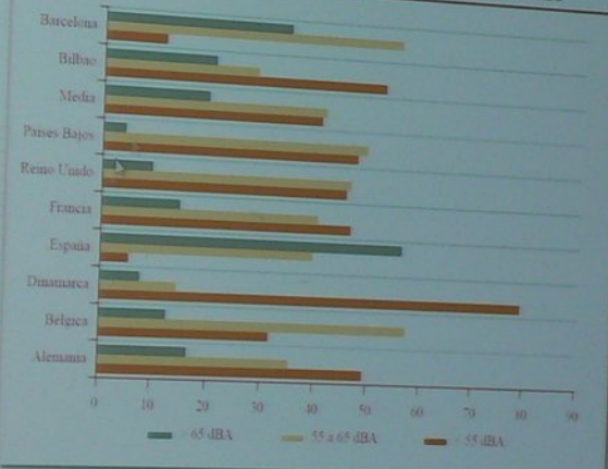
PORCENTAJE DE POBLACION EXPUESTA EN DIFERENTES PAISES